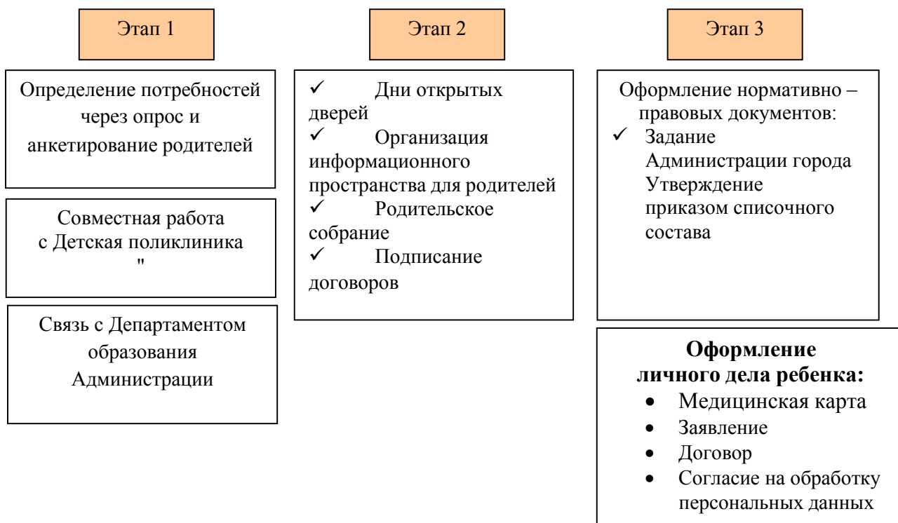
Рис. 3. «Этапы организации детей КМП»

С целью изучения степени удовлетворенности родителей качеством образовательных услуг консультационно – методического пункта, предоставляемых дошкольным образовательным учреждением, условиями пребывания их детей в детском саду, с целью выявления мнения родителей о получении образовательных услуг, а также возможные пожелания предусмотрено проведение социологического исследования удовлетворенности родителей качеством услуг консультационно – методического пункта, предоставляемых образовательным учреждением в периодичности 1 раз в квартал средствами анкетирования.